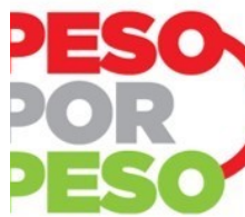
Resultados de la Convocatoria del programa Peso por Peso 2018