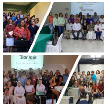
Primer taller operativo y presupuestal del programa Peso por Peso 2018