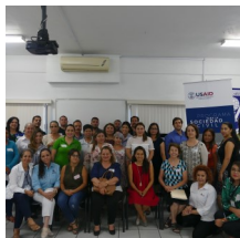
Taller sobre normatividad básica impartido por USAID-INDESOL