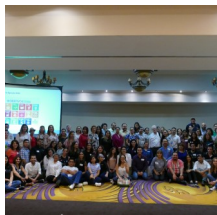
Taller Voluntariado Objetivos del Desarrollo Sostenible-Voluntariado ONU